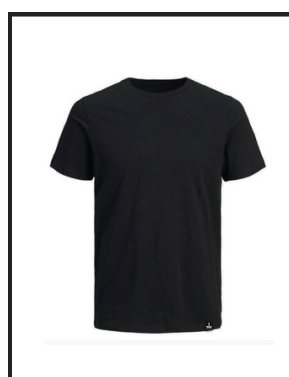
REMERAS DE ALGODÓN