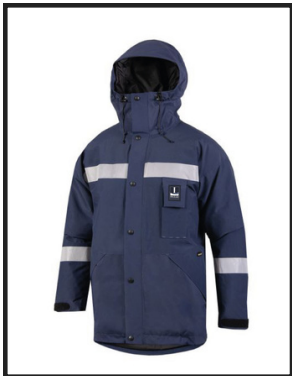
CAMPERAS DE TRABAJO