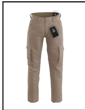
PANTALONES DE TRABAJO